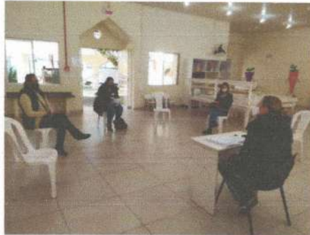
CEI's da Afasc disponibilizarão sugestões de atividades a partir de setembro

Pensando em minimizar eventuais perdas escolares para as crianças dos 32 Centros de Educação Infantil (CEI) da Associação Feminina de Assistência Social de Criciúma (Afasc), a equipe do Departamento de Educação Infantil (DEI), juntamente com professores e equipe técnica, está seguindo o Parecer nº 09/2020 do Conselho Nacional de Educação, e já disponibilizará, a partir da mês de setembro, sugestões de atividades para todas as faixas etárias atendidas pela instituição.